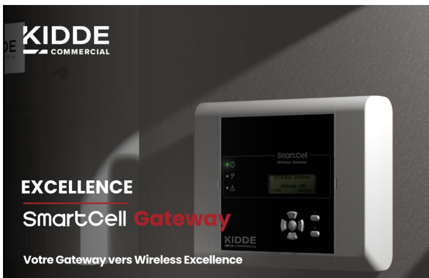
Image 2: Le Gateway d'Excellence SmartCell est conçu pour l'évolution à long terme de l'infrastructure de sécurité d'un bâtiment.

The image(s) distributed with this press release are for Editorial use only and are subject to copyright. The image(s) may only be used to accompany the press release mentioned here, no other use is permitted.