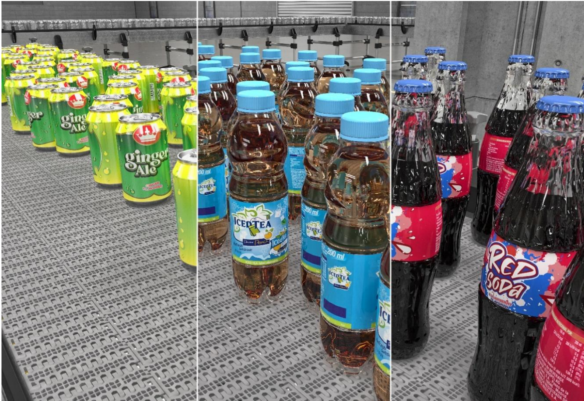
Bild 1: Ob Flaschen, Dosen oder Sonderformen, Regal Rexnord unterstützt die Anlagenoptimierung in jeder Phase.