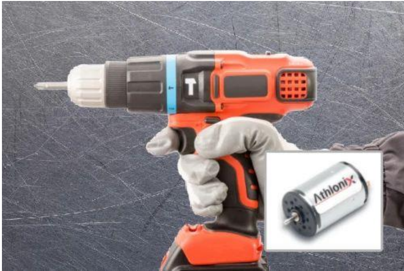
Image 1 : Les moteurs CC sans fer garantissent un fonctionnement sûr et performant des appareils sur batterie