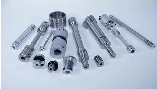
Bild 3: Huco hat sich den Ruf erworben, ein umfassendes Angebot an Standard- und kundenspezifischen Präzisionskupplungen für Erstausrüster von Nahrungsmittel- und Getränkemaschinen zu liefern.

Das mit dieser Pressemitteilung zur Verfügung gestellte Bildmaterial darf nur in Zusammenhang mit diesem Text verwendet werden und unterliegt dem Urheberschutz. Bitte wenden Sie sich an DMA Europa, wenn Sie eine Bildlizenz für die weitere Verwendung benötigen.