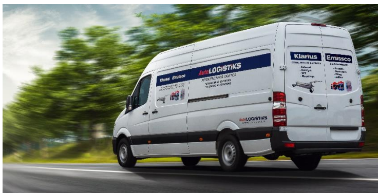
Foto 1: Klarius bouwt Europese distributie voor premium uitlaatdelen uit